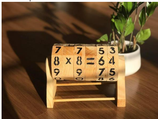
Những sản phẩm sáng tạo từ gỗ, thân thiện với môi trường.

"Nhưng nhìn chung, tôi thấy 2 công việc trước kia và hiện tại tương hỗ cho nhau rất nhiều. Nghề kiến trúc hay làm mộc đều là sự kết hợp khéo léo giữa khoa học, nghệ thuật và kỹ thuật. Ví dụ như thay vì vẽ nhà cửa, cảnh quan thì mình vẽ sản phẩm, tìm ý, phối màu cho đồ chơi" - chị Hảo chia sẻ.