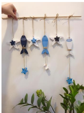
Dưới bàn tay tài hoa của nữ thợ mộc, những miếng gỗ thừa trở thành sản phẩm vạn người mê.

"Từ ngày bố tôi được trở lại làm mộc, ông vui lắm, ông còn tự tay lát gạch làm nền ở xưởng cho tôi. Nói là xưởng nhưng thực chất là phần đất trống ở phía cạnh chuồng gà" - chị thật thà nói.